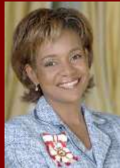
Мікаель Жан (2005-2010)