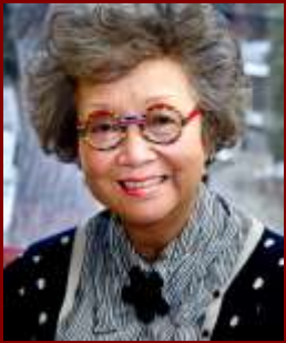
Адрієн Кларксон (1999-2005)