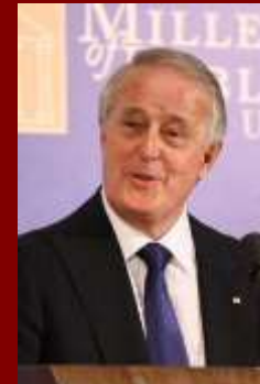
Девід Ллойд Джонстон (з 1 жовтня 2010 до сьогодні)