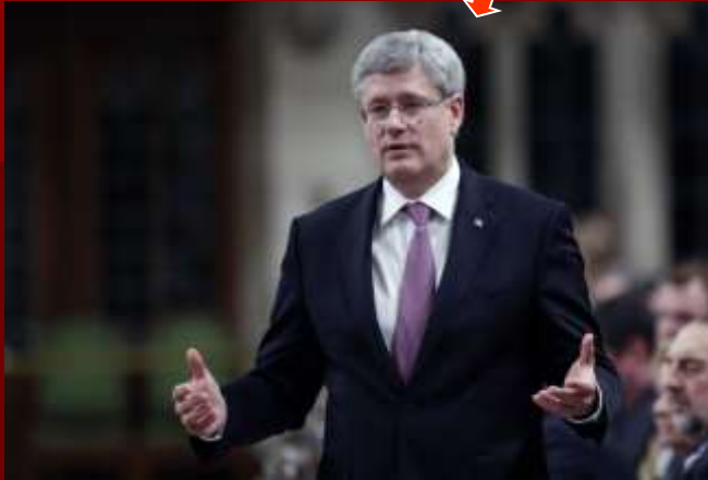
Путіну у 2014р.

Ліберальна партія загрузла в корупції і численних скандалах. На нових виборах у 2006 р. до влади прийшла Консервативна партія, її лідер С. Гарпер (2006- 2015 рр.).