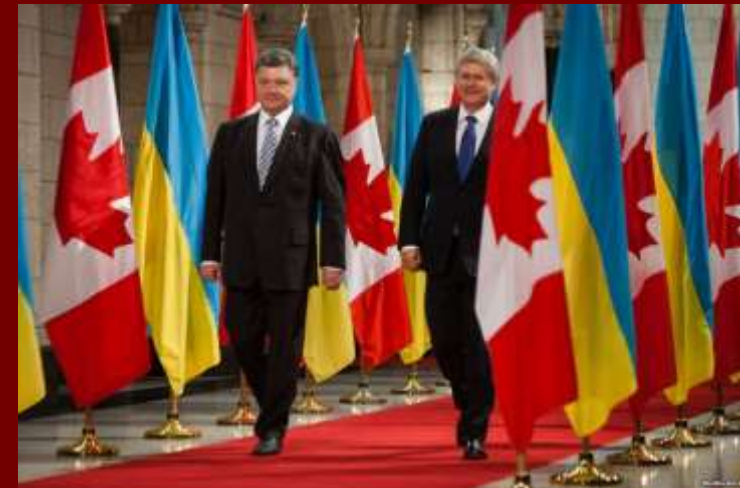
Зустріч С. Харпера та П. Порошенка 19 червня 2015 року

☆ Підтримка військової операції в Афганістані та Ізраїлю у війні з Ліваном у 2006 р.