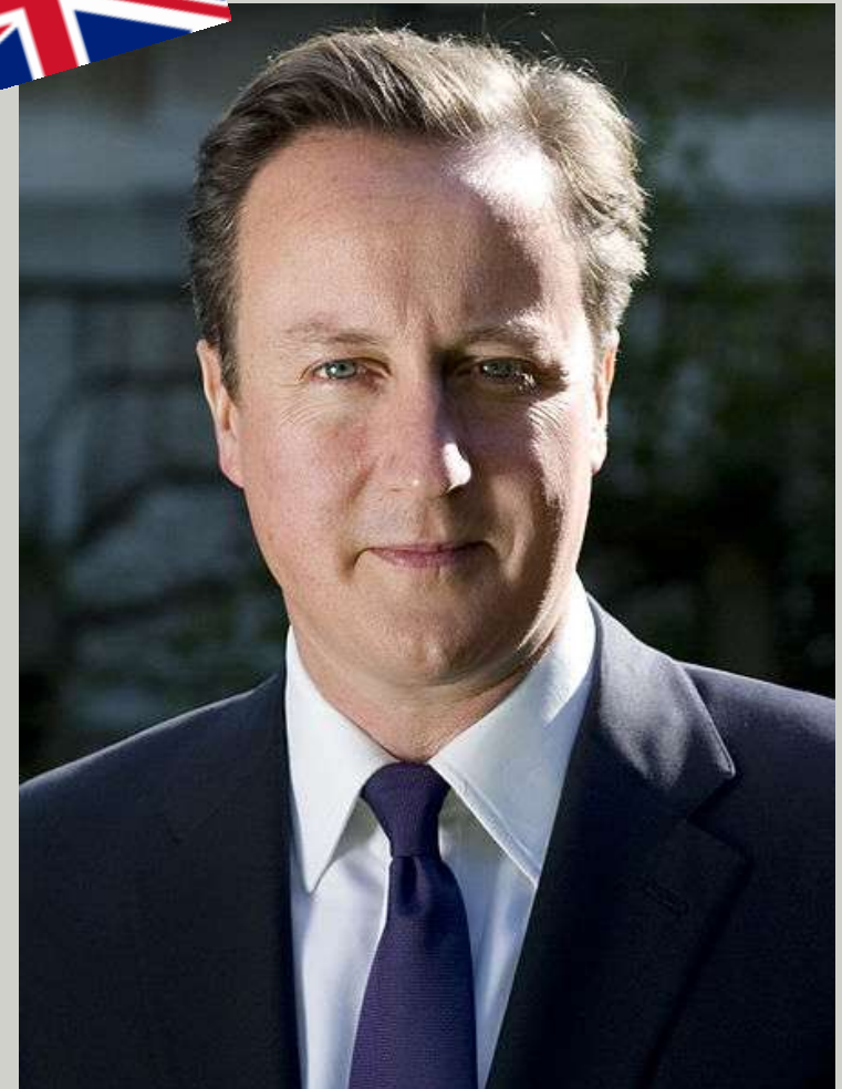
Девід Кемерон - опозиція