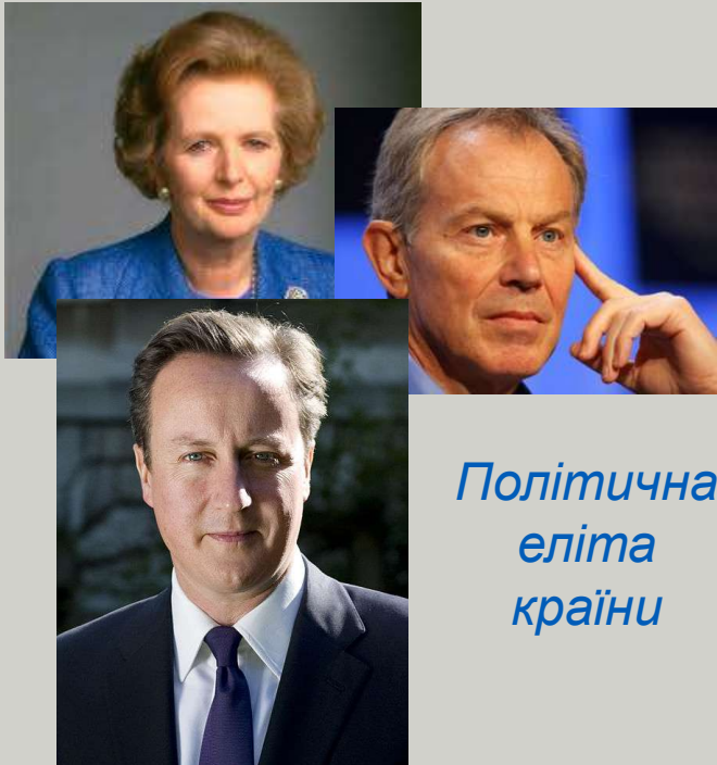
Політична еліта країни