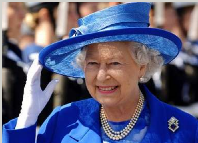
Королева Єлизавета II

“Ідеали зберігаються тільки шляхом змін. Якщо вони не відповідають змінам – вони гинуть.”